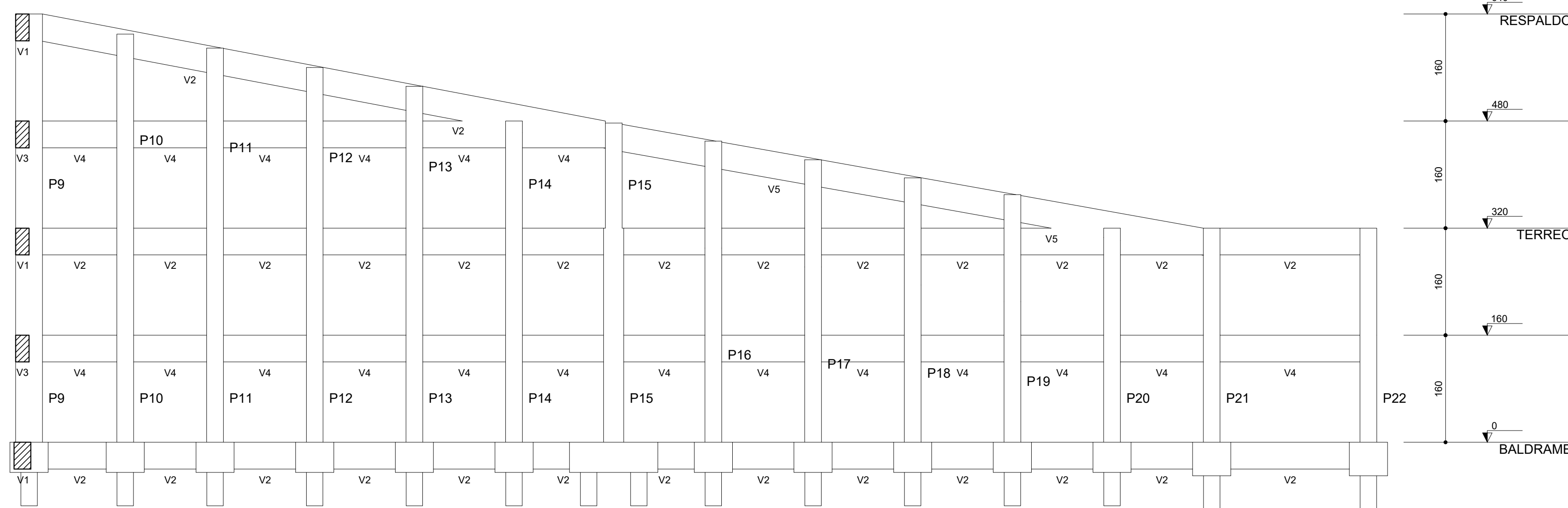
Corte A-A escala 1:50

PESO TOTAL (kg) CA50 368.8 CA60 153.2 Volume de concreto (C-25) = 5.31 m³ Área de forma = 66.36 m²